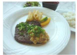
牛ステーキランチ ¥1,030