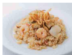
シーフードピラフ ¥1,030